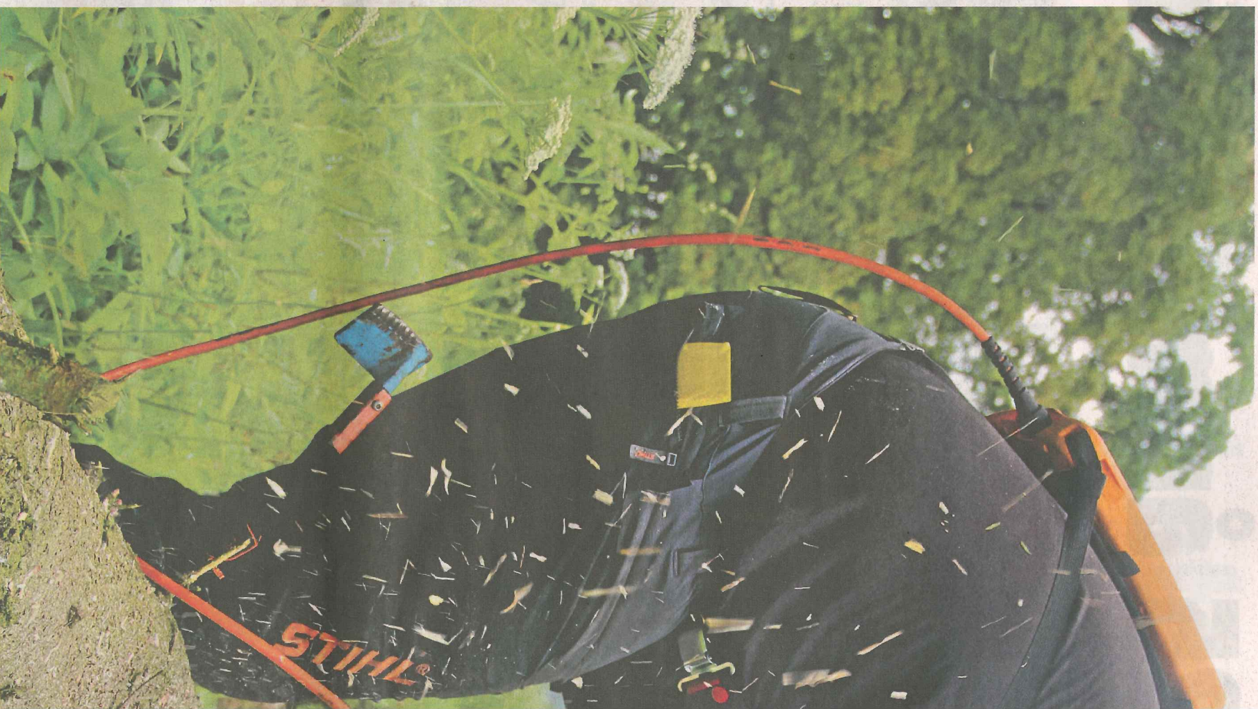
LÄTT OCH SMIDIGT. Arboristsågen från Pellenc visade sig ligga perfekt i händerna på ATL