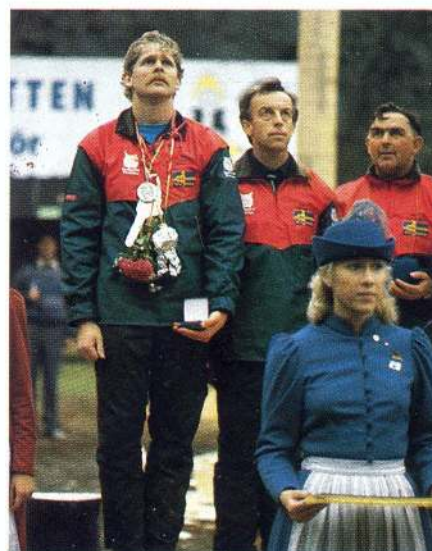
Allvarets stund. Det svenska silverlaget lyssnar till Finlands nationalsång.