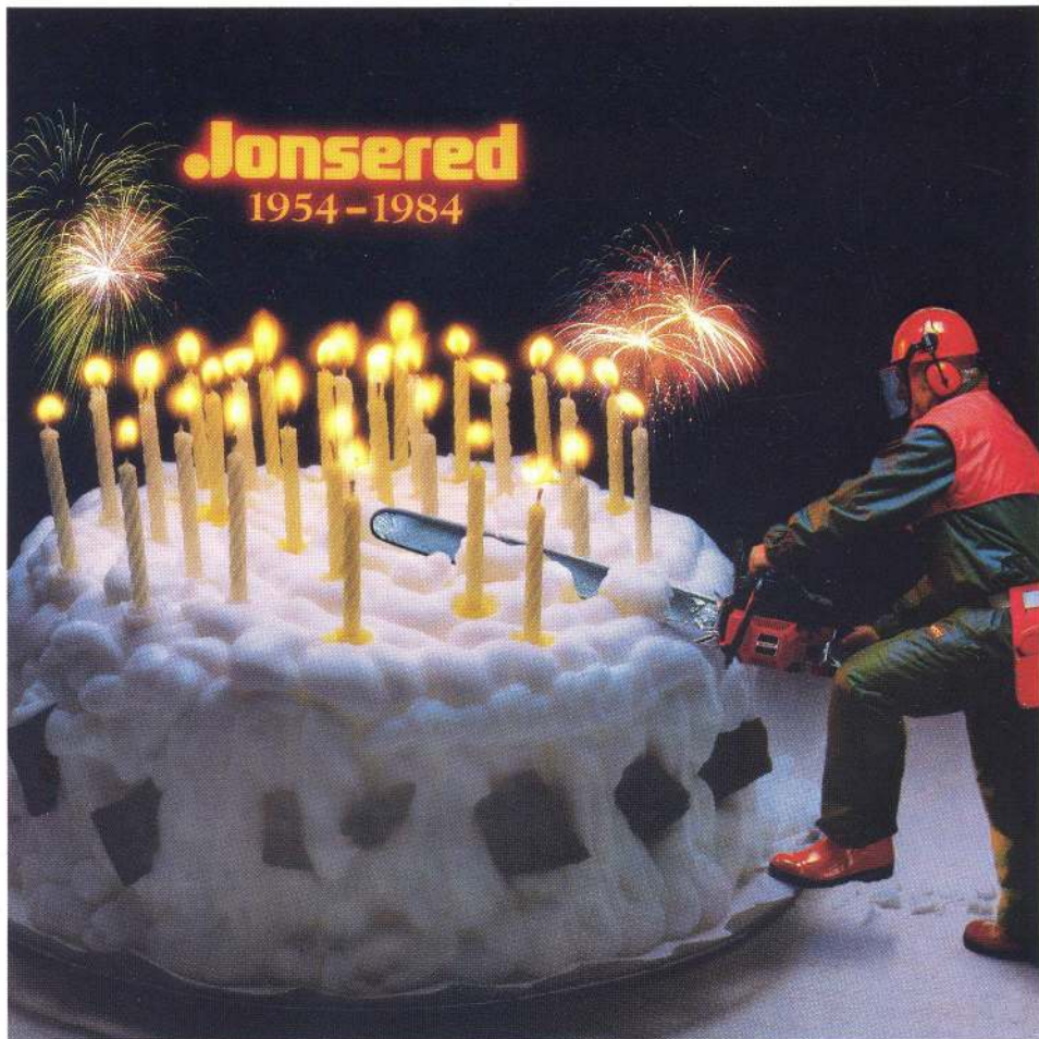
Vi garanterar att du kan skära din jubileumstårta med en vanlig tårtspade. Jonsered 920 Super används bara när diametern närmar sig metern.

Därför får du nu ett festligt erbjudande. Köper du en Jonsered 525 före den 21 december bjuder vi på en läcker tårta. Erbjudandet gäller i alla Jonsered Sågbutiker. Den närmaste hittar du i listan nedan.