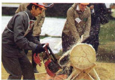
— Det ser ut som han kör moped. Sovjetunionens sågar väckte stort uppseende och kommentarerna var många.