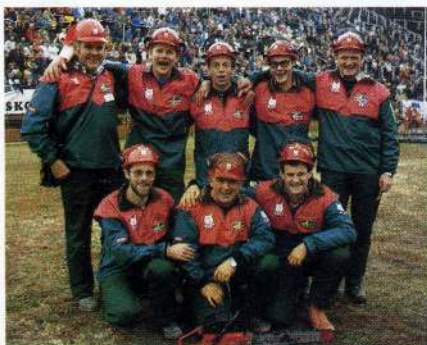
När det verkligen gäller litar landslaget på Jonsereds ProLine kläder.