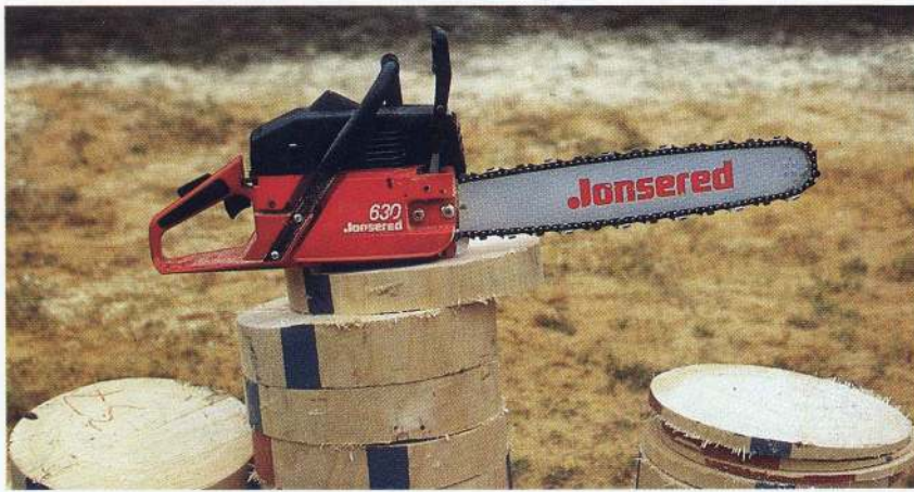
Jonsered — alltid på topp.