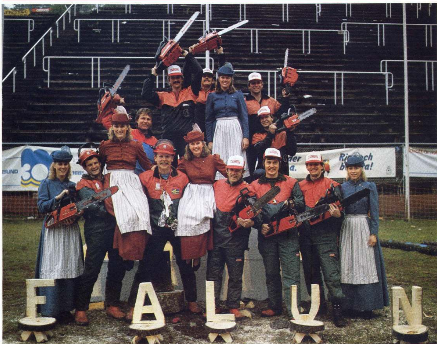
Alla Jonsered-huggare firar att Sverige tog silver både individuellt och i lag.

Information från Jonsered Motor AB, 433 81 Partille. Tel. 031-72 03 00.